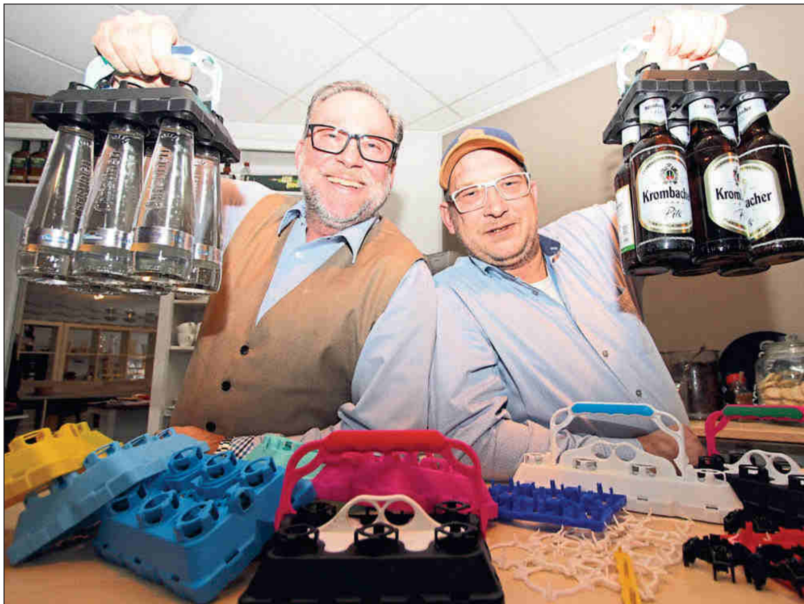
Die Erfindung wird zum Fernsehstar: Bob, der Flaschenträger, ist serienreif. Erfinder ist der Konstrukteur für Spritzgusswerkzeuge in der

Abonnentenservice Telefon 0 52 07 / 91 32 10 Fax 0521 / 585-371 Anzeigenannahme Telefon 0521 / 585-8 Fax 0521 / 585-480 Lokalredaktion Holter Kirchplatz 21, 33758 Schloß Holte-Stukenbrock Monika Schönfeld 0 52 07 / 91 32 12 Matthias Kleemann 0 52 07 / 91 32 14 Bernd Steinbacher 0 52 07 / 91 32 13 Fax 0 52 07 / 91 32 17 SHS@westfalen-blatt.de Lokalsport 0 52 07 / 91 32 16 sport-SHS@westfalen-blatt.de www.westfalen-blatt.de