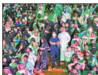
In Saudi-Arabien dürfen künftig auch Frauen ins Fußballstadion.

Dschidda (dpa). Eine weitere Premiere in Saudi-Arabien: Frauen dürfen am kommenden Freitag erstmals in der Geschichte des Landes ein Fußballspiel besuchen. Weibliche Besucher seien – in Begleitung ihrer Familien und in speziellen Familienblöcken – im Stadion der Hafenstadt Dschidda bei einer Partie der ersten saudischen Liga zugelassen, teilt die Regierung mit. In dem isla-